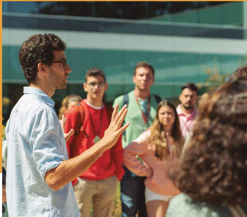
Programa començat l'any 2012

L'any 2023 hi han participat 6.570 escoles