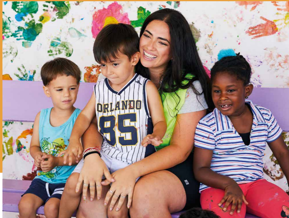
Programa començat l'any 2007